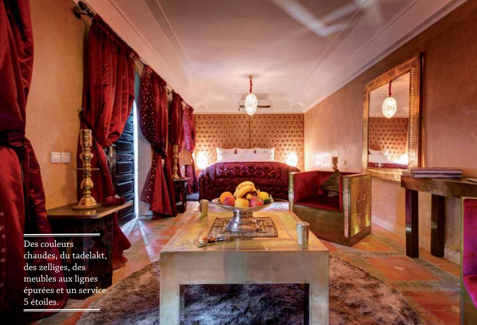
Des couleurs chaudes, du tadelakt, des zelliges, des meubles aux lignes épurées et un service 5 étoiles.